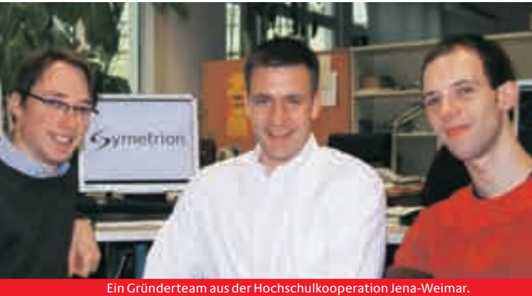
Ein Gründerteam aus der Hochschulkooperation Jena-Weimar.

So fing alles an: In den ersten beiden Phasen von EXIST stand der Aufbau regionaler Hochschul-Gründungsnetzwerke im Vordergrund. Ziel war es, eine Kultur der unternehmerischen Selbstständigkeit in Hochschulen und Forschungseinrichtungen zu verankern und akademische Gründungen auf den Weg zu bringen. Das Ergebnis kann sich sehen lassen: Mittlerweile gibt es bundesweit 35 EXIST-Regionen (EXIST-Initiativen und Partnerregionen).