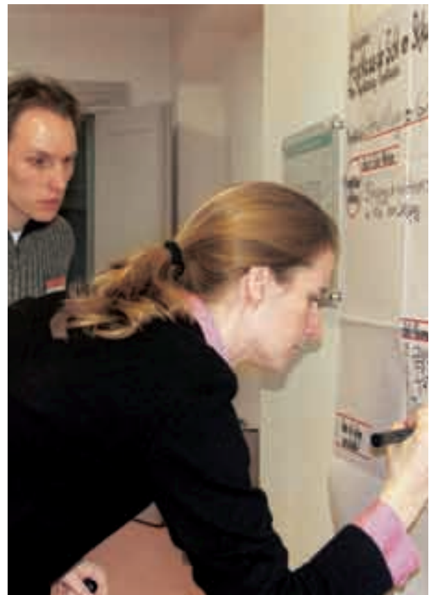
Projektplanung in einem EXIST III-Projekt.

Weitere Informationen zu EXIST III sowie zur Antragstellung finden Sie unter www.exist.de